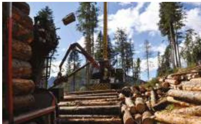
Comelico - Taglio fitosanitario delle Regole

Tra queste pratiche agricole, in cui la pioppicoltura ancora ricopre il principale interesse per molte aree della pianura, si deve se-