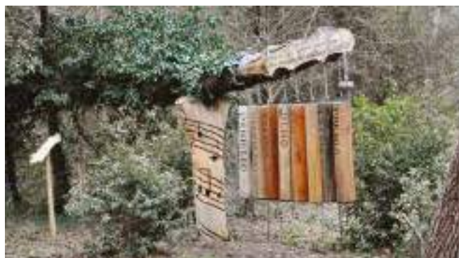
Bosco Nordio - Funzione turistica

gnalare il rilevante sviluppo dell'agroforestazione, che a fronte di una maggior complessità gestionale, può portare ad un maggiore ritorno economico e molteplici benefici ambientali. Si parlerà di questo nel primo Forum nazionale di Agroforestazione a Roma il 6-7 dicembre organizzato dall'AIAF – Associazione Italiana di Agroforestazione.