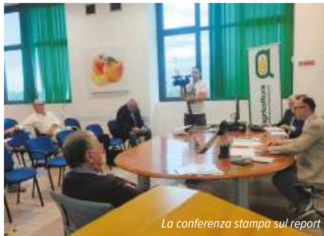
La conferenza stampa sul report

Verona, purtroppo, è tra le prime province, ma stavolta in negativo, per la siccità, dato che nella nostra provincia sta piovendo poco. Quest'anno, dopo il primo semestre, c'è stato tuttavia un recupero della piovosità, che ci permetterà di chiudere la stagione in modo positivo. Presenteremo il riassunto complessivo di com'è andata