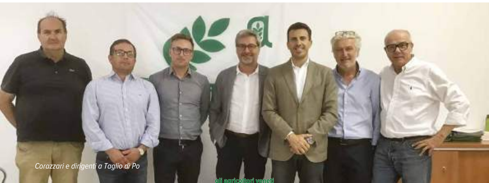
Corazzari e dirigenti a Taglio di Po