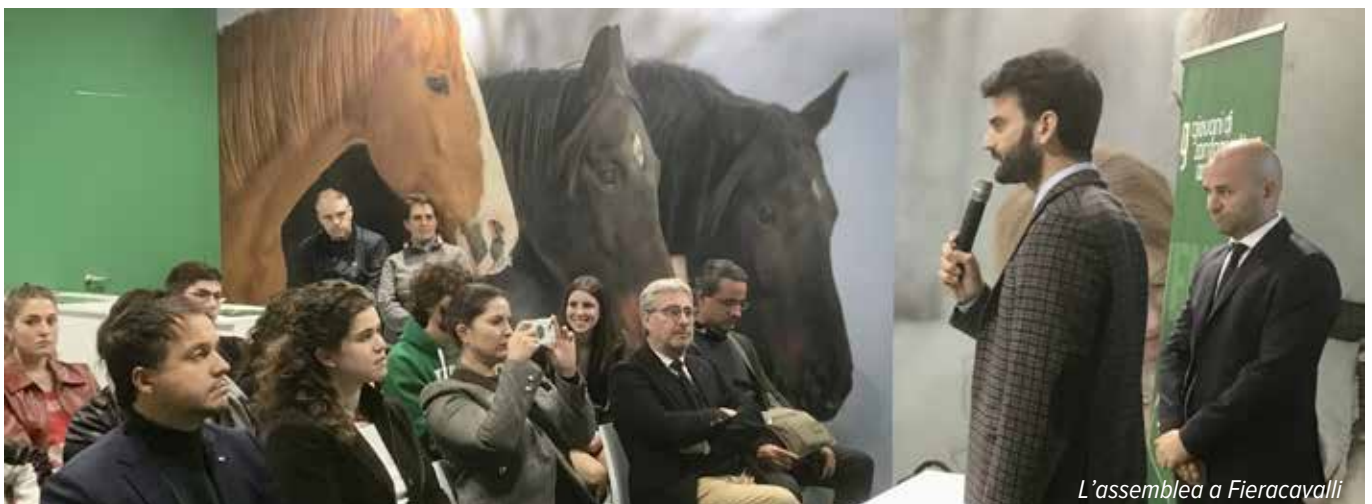
L'assemblea a Fieracavalli